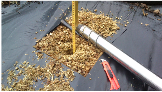
Udtagning af prøver i forskellige dybder

Resultatet af den mikrobiologiske analyse viser, at indholdet af benzosyre er lavere i de øverste 2 cm med vandig opløsning, set i forhold til behandlingen med granulat. Til gengæld er koncentrationen 1,5 micromol pr. kg i 3-39 cm dybde med vandig opløsning, hvor det med granulat behandling var 0.