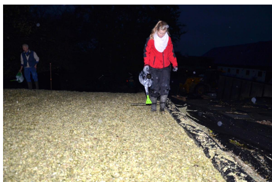
Udvanding med vandkande med bredspredere

Blandingen blev opløst med piskeris i en murerbalje og efterfølgende udvandet med vandkande med bredspredere, umiddelbart inden tildækning af stakken med plastik.