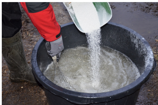
Blandingen opløses i murerbalje med piskeris

Blanding: 14,4 kg Natriumbenzoat + 30,6 liter vand, dvs. lidt over 1 liter pr. m 2 .